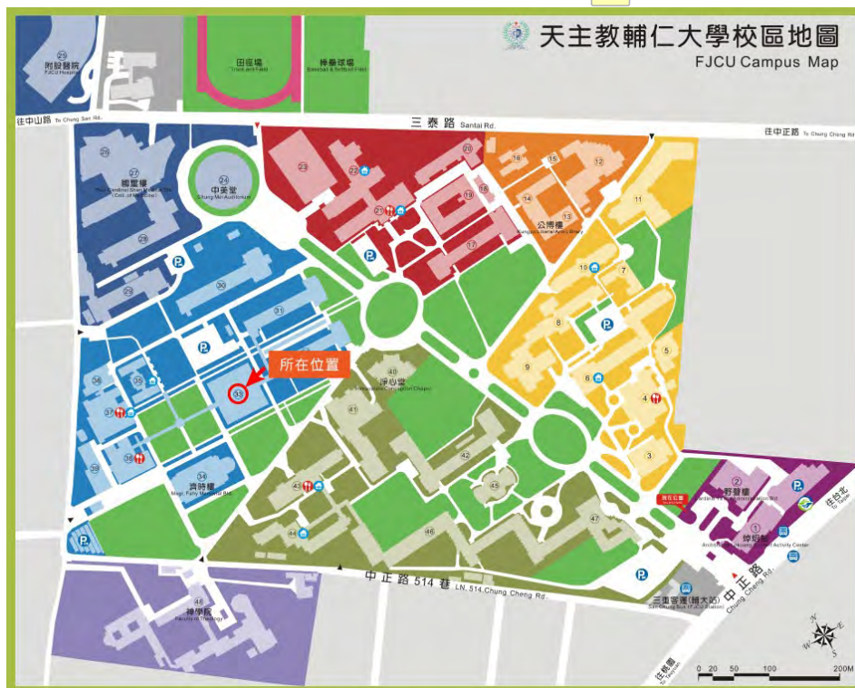
圖 貳-1 天主教輔仁大學校區地圖

我是範例我是範例我是範例我是範例我是範例我是範例我是範例我是範例 我是範例我是範例我是範例我是範例我是範例我是範例我是範例我是範例。